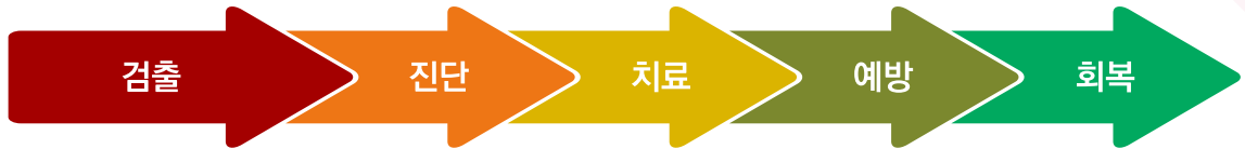
[그림 1] ICT 기술을 적용할 수 있는 전염병 관리 단계

흐름에서 형식, 출처 같은 표준의 부족으로 비교가 어렵다는 문제점이 있다. 양질의 데이터는 정확한 진단, 효과적 치료, 회복 추적을 가능하게 한다.