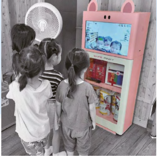
세이프핑키. AI 기반으로 아이의 등·하원시간, 발열측정정보, 환경데이터(초미세먼지/CO 2 등)를 전산화하여 관리하고 학부모 안전 예방 알림을 전송한다.