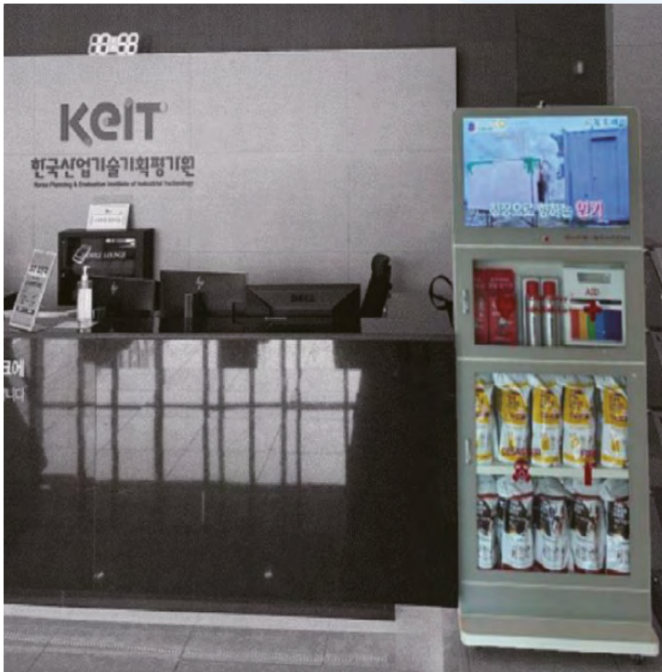
세이프스테이션. 건물 내 CCTV를 이용하여 화재 발생 시 건물 내부의 화재와 생존자 위치를 디지털 변환된 도면을 통해 모니터링하여 가장 안전한 생존 및 구출 경로를 제공한다.