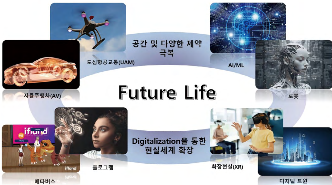
[그림 2] 2030 유망 서비스 전망

5G의 시작과 함께 본격화된 스마트 시티·스마트 팩토리·스마트 오피스 등은 서비스의 완성도 제고와 함께 고도화가 진행될 것이며, 서비스 개념과 목표는 제시됐지만 기술 한계로 도입되지 못했던 서비스들